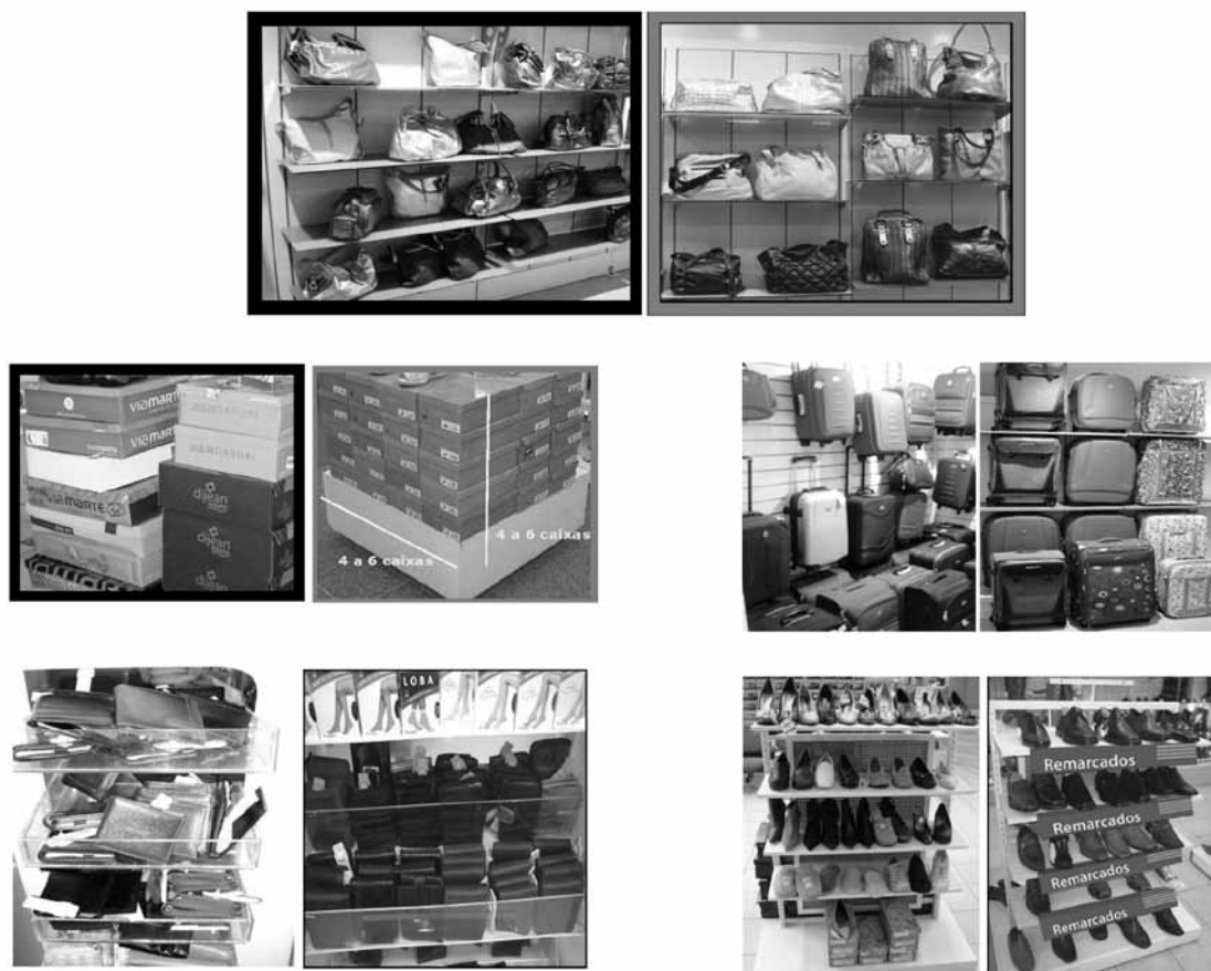
Figura 3 – Agrupamento, posicionamento, ordena33o, apresenta33o, volume, combina33o de cores e sinaliza33o dos produtos (antes e depois)

Nota: Imagens publicadas com autoriza33o.